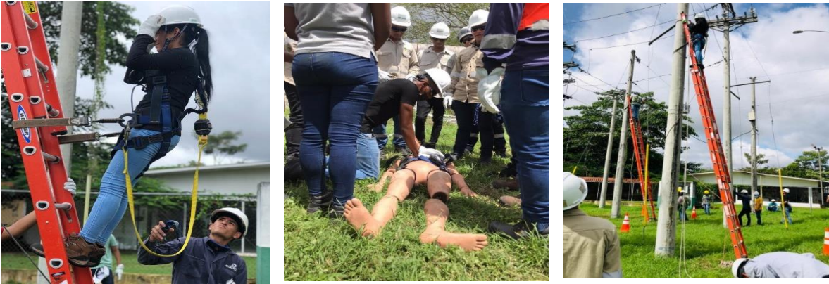
Semillero del programa ELBT ENSA-INADEH-MEDUCA

instrumento y cumplir con los requisitos para certificar a los que se desempeñan en el oficio de mecánicos de refrigeración. Seguimos en espera de la Instalación de la oficina de CONACOM, pero se avanza en el proceso de elaboración de la norma.