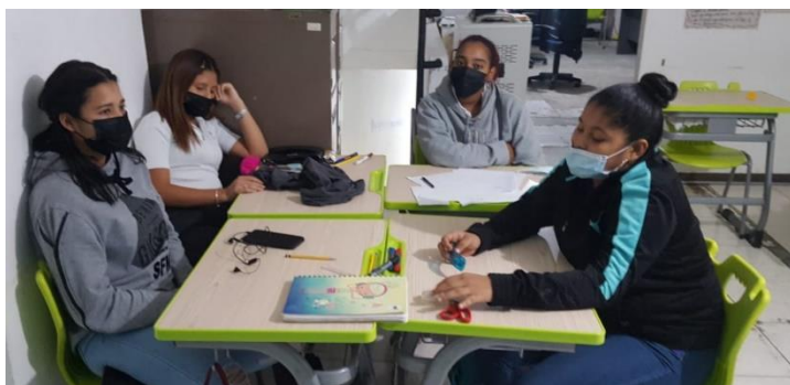
Ilustración 1 Convenio Voces Vitales El Chorrillo-Centro Bonifacio Pereira

En este Convenio con Voces Vitales, Las Claras e INADEH, se capacita a jóvenes adolescentes en riesgo, con la finalidad que al terminar su bachillerato puedan insertarse en el Mercado Laboral, de allí que se les complementa con el Programa de Asistente Administrativo, actualmente se están desarrollando dos programas uno en Centro Bonifacio Pereira con 9 participantes y otro en el Centro de Tocumen con 13 participantes.