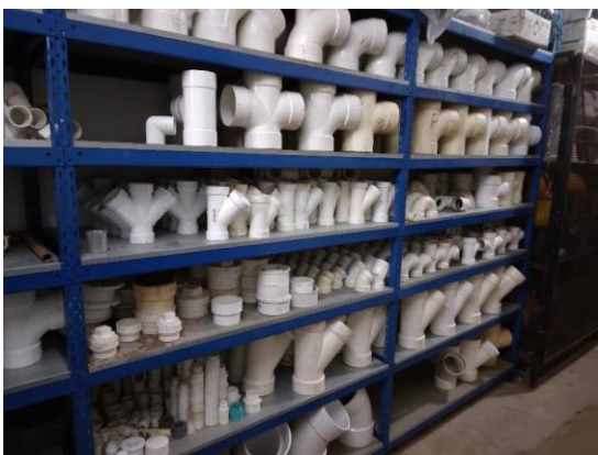
Depósito de Insumos de Plomería

También la visita fue aprovechada para conocer los talleres de plomería y albañilería del Centro.