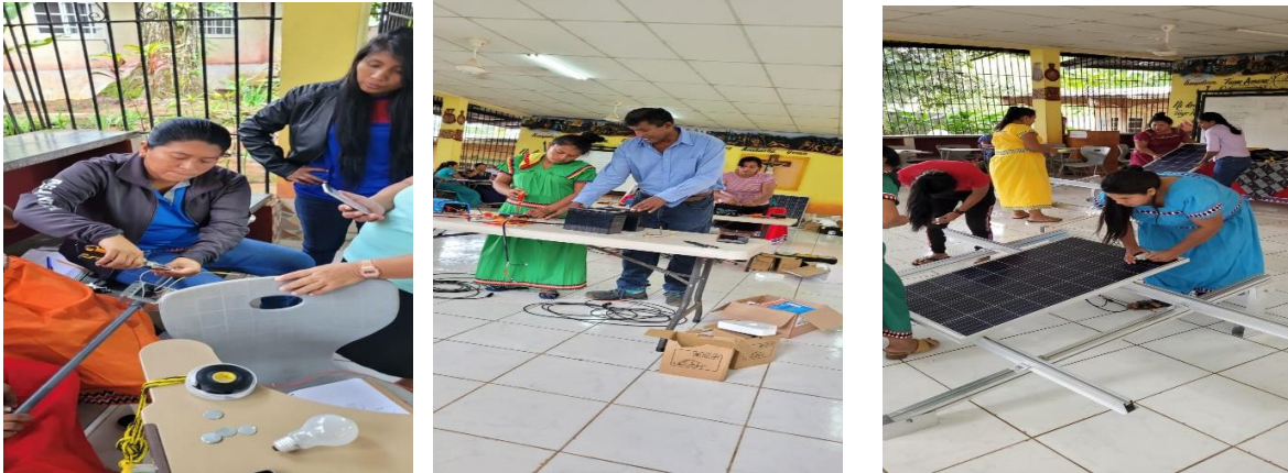
Mujeres de Comarca Ngäbe Buglé, en el inicio del curso de Instalación y mantenimiento de Sistemas fotovoltaicos.

Se adjuntan imágenes de estas actividades de Formación.