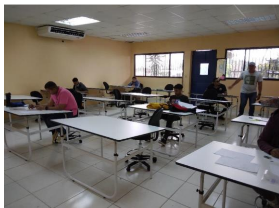
Salón de Plomería