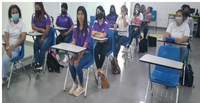
Ilustración 2 Convenio Voces Vitales Las Claras-Centro Tocumen